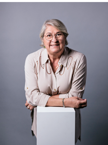
Nathalie Lorson © Firmenich